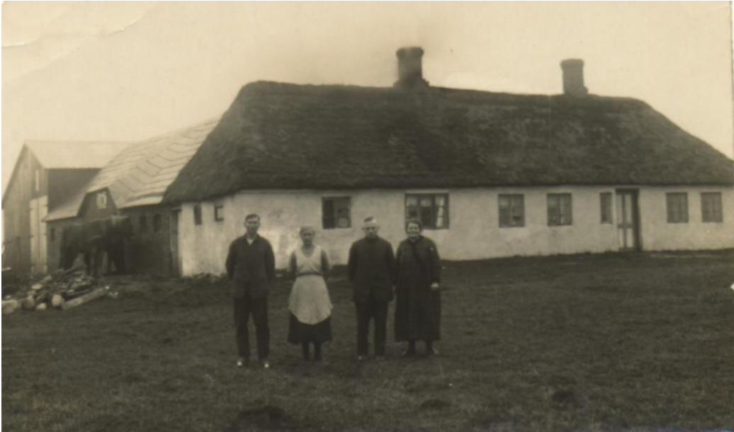
Lering 1926. (Hvingelvej 26. Hee sogn, Ringkøbing amt.)